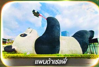
แพนด้าเซฟี่