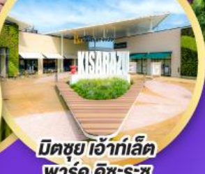
มิตซูเอะอิเกะอิ พาร์ค คิซะระซู