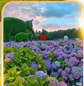
ดอกไม้ตามฤดูกาล