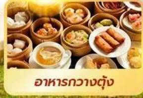
อาหารกวางตุ้ง