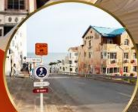
ถนนอ่าวจวีป่า