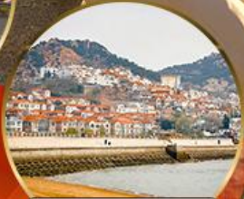
ซาจือโข่ว