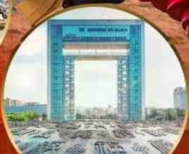
ประตูแห่งความสุข