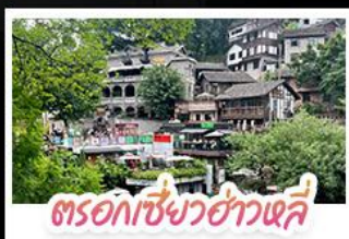
ตรอกเซี่ยวฮ่าวเฉี