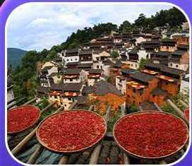
“หมู่บ้านหวงหลิง”

หุบเขาเทวดาวังเซียนกู่ หมู่บ้านที่ตั้งอยู่ริมหน้าผา • หมู่บ้านโบราณหวงหลิง ป่าสนน้ำชิงซาน • ล่องเรือทะเลสาบซีหู • ถนนโบราณตุ๋นโจ้ว • ชมแสงสีที่ ฉู่หนีโจ้ว