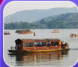
“ล่องเรือทะเลสาบซีหู”