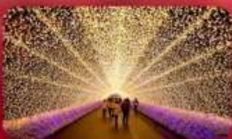
นาบานาโนะซาโตะ