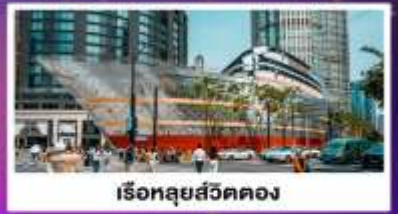
เรือหลุยส์วิตตอง