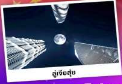
ดูเจ็ทสูย