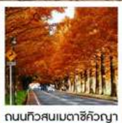
ถนนทิวสนเมตาชิคิวญา