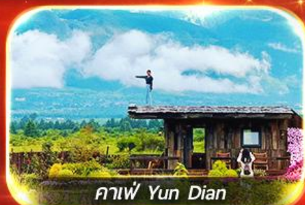
กาแฟ Yun Dian