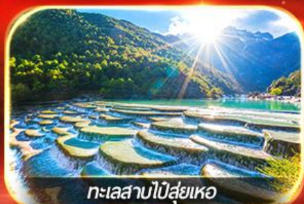
ทะเลสาบไม้ส่ายเหอ