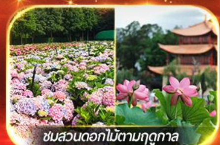
ชมสวนดอกไม้ตามฤดูกาล

นั่งกระเช้าสู่กุเขาศิมะมังกรหยก ชมโชว์ทิเบต "Impression Lijiang" สุดอลัง เชคอินคาเฟ่วิวกุเขาศิมะ, ชมดอกไม้ตามฤดูกาล