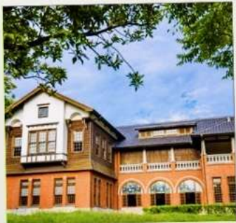
พิพิธภัณฑ์น้ำพุร้อนเป่ย์โถว