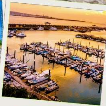
ท่าเรือประมงตั้นสุ่ย