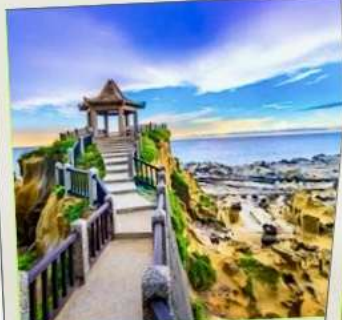
อุทยานเกาะเหอผิง