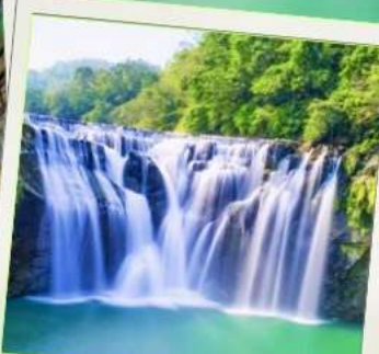
น้ำตกสี้อเฟิ่น