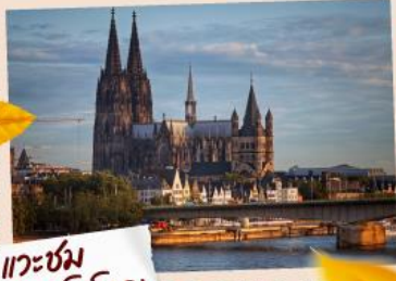
แวะชม มหาวิหารโคโลญ