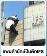
แพนด้ายักษ์ปีนตึกIFS