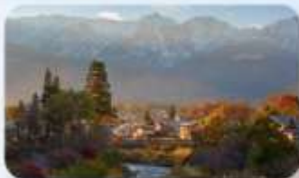
โออิเตะ ปาร์ค