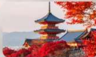
วัดคิโยมิชิ