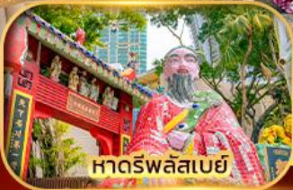
หาดร์พลัสเบย์