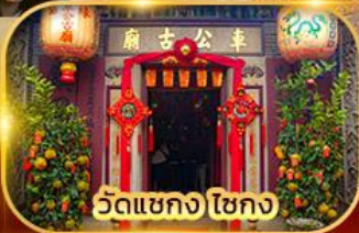
วัดเขกง ไชกง