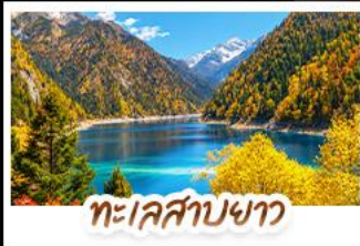
ทะเลสาบขาว