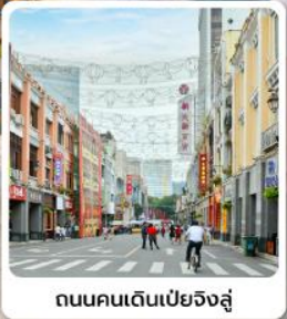
ถนนคนเดินเป่ย์จิงลู่