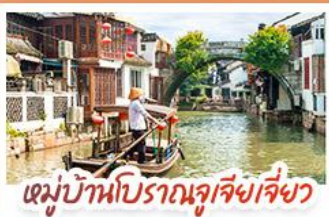
หมู่บ้านโบราณจูเจียงเจี๋ยว

สวนสนุกเซี่ยงไฮ้ดิสนีย์แลนด์ เต็มวัน (รวมรถรับ-ส่ง)