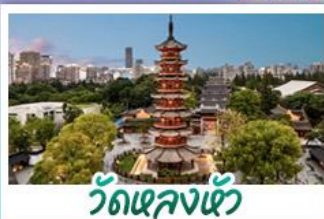
วัดเลงเซ้ง