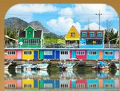
ท่าเรือจังกึม