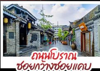
ถนนโบราณ ชอยกว้างชอยแคบ