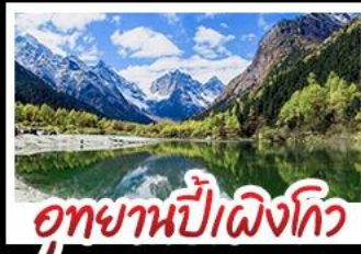
อุทยานปี่ผิงโกว