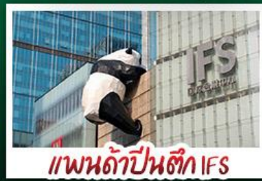
แพนด้าป็นตัก IFS