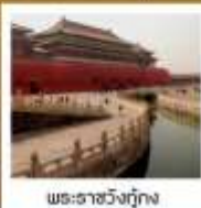
พระราชวังกรุงปักกิ่ง