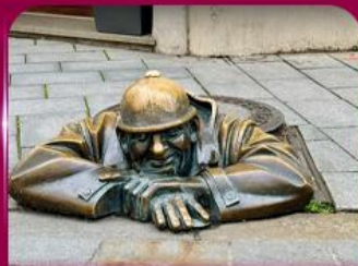
เซลฟี่คูคูมิล บราติสลาวา