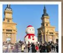
ตึกตาคิยะ-ยักซ์