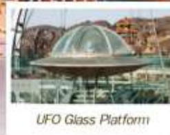
UFO Glass Platform