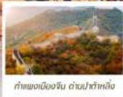
กำแพงเมืองจีน ด้านป่าหิมะ