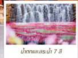
น้ำตกและสระน้ำ 7 สี

📦 โหลด 23 KG. x1 ทั้งไป - กลับ ✓ ฟรีนียบตัว ✓ ไม่เข้าร้านรัฐบาล ✓ ทีวีรูปเล็ก ✓ รวมค่าเข้าชมตามที่ตามโปรแกรม