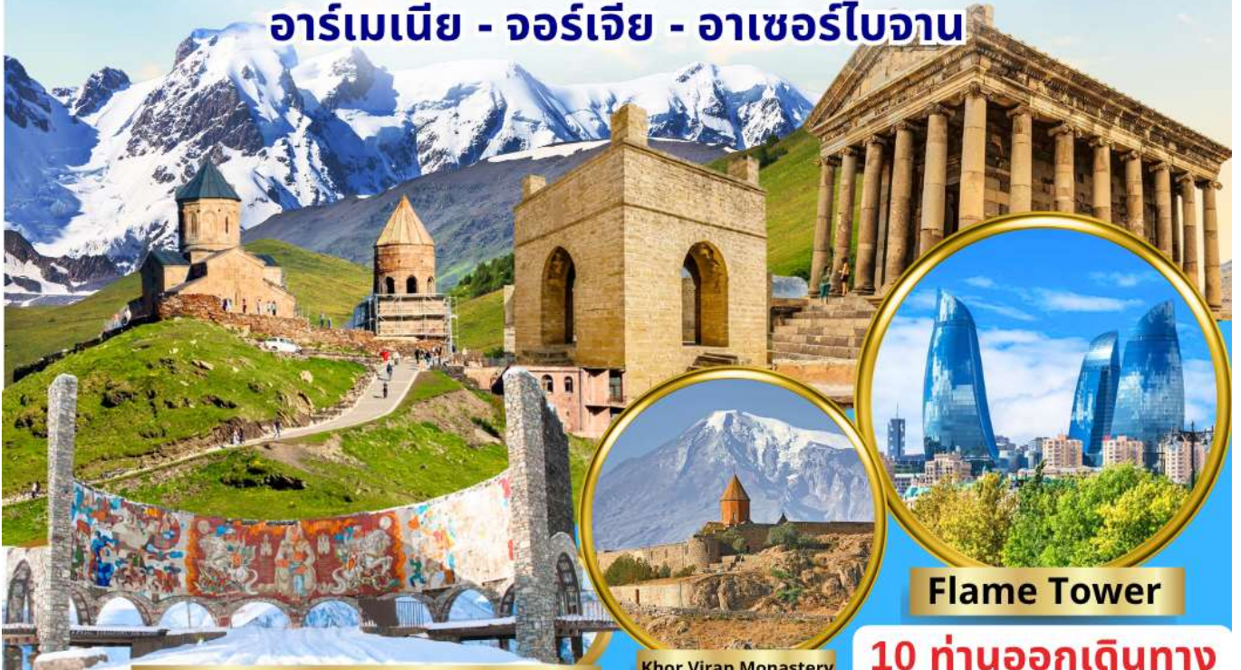
Georgian-Russian Friendship Monument