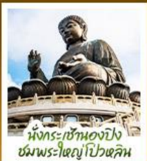
นั่งกระเช้ามองปิง ชมพระใหญ่ไถ่หลิน

นั่งกระเช้ามองปิงสักการะพระใหญ่ไถ่หลิน • วัดหวังต้าเซียน ขอพรสุขภาพ ความรัก วัดเขกงหมิว ขอพรองค์เขกง โชคลาภ การเงิน และธุรกิจ • เทพเจ้ากวนไท ความซื่อสัตย์ เงินทอง ธุรกิจมั่นคง • เจ้าแม่กวนอิมรีพลัสส์บย รับพลังงานดี เสริมพลังฮวงจุ้ยที่รีพลัสส์บย