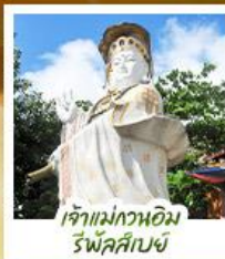
เจ้าแม่กวนอิม รีพลัสส์บย