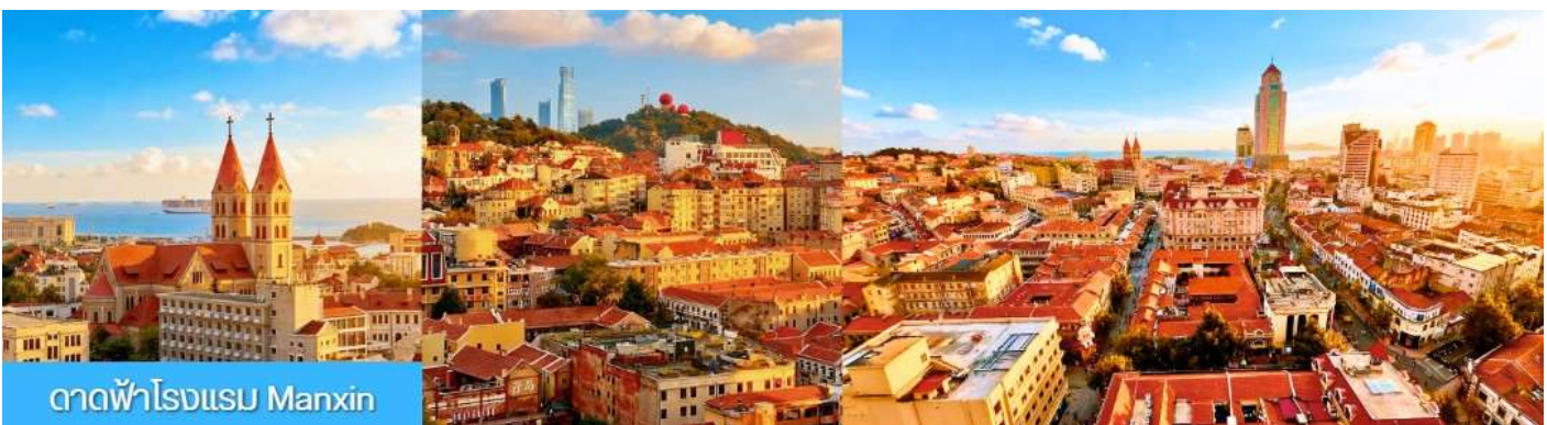
ดาดฟ้าโรงแรม Manxin

กลางวัน อิสระอาหารเพื่อที่ท่านมีความสุขในการเดินช้อปปิ้ง และท่านสามารถเลือกชิมอาหารพื้นเมืองตามอัธยาศัย จนได้เวลาอันสมควร ตามเวลานัดหมาย นำท่านเดินทางสู่ ถนนหลงเจียงลู่ ให้ท่านถ่ายรูป ถนนหลงเจียงลู่ ถนนสายการ์ตูน อะนิเมะ น่ารัก ๆ เหมาะกับการถ่ายรูป เช็คอิน