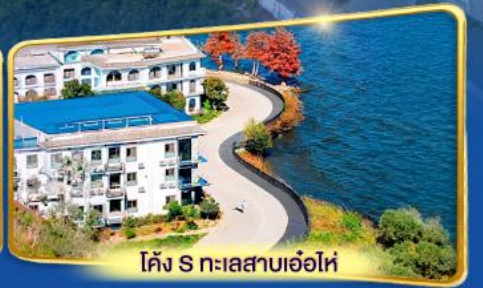
โค้ง S ทะเลสาบเอ๋อไห่