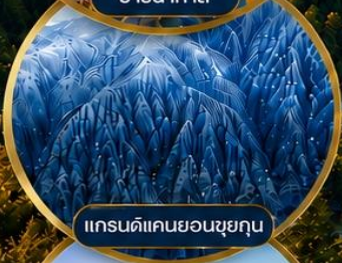
แกรนด์แคนยอนซุยกุณ