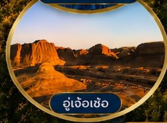
อู่เจ้อเซ่อ