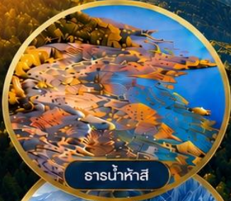
ธารน้ำห้ำสี่