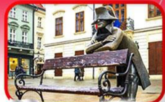
ย่านเมืองเก่าปราทิสลาวา

เที่ยวเมืองสวยริมทะเลสาบ ฮัลล์สตัดท์ • ชมเมืองไข่มุกแห่งโบฮีเมีย เซสกี กรุงลอน • ปราก • เวียนนา • ซอปปิงพาร์นดอร์ฟ เอาก์เล็ท